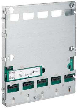
BACK-500 3866 Base soporte para 5 módulos HTI