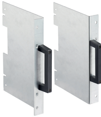
SR-HTI 3867 Soporte rack 19" de 6U de altura